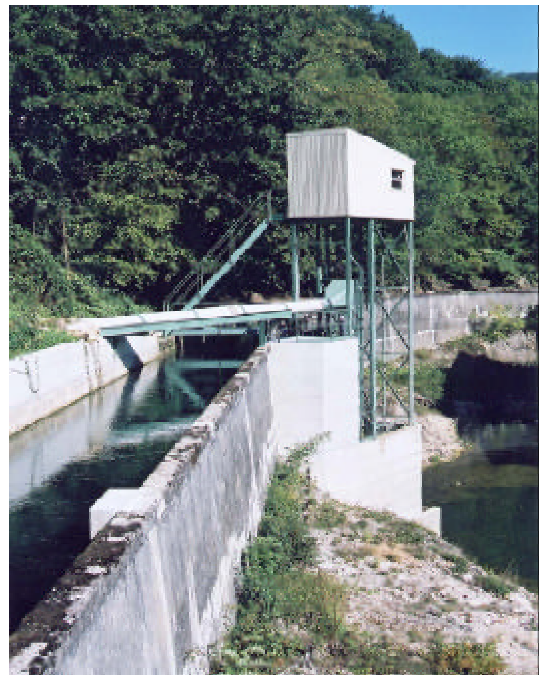
Ansicht von Oberwasser mit Abschwemmleitung

Als einzige realisierbare Lösung verblieb der Bau eines Fischliftes in möglichst geringem Abstand zum Überfall, aber ausserhalb der turbulenten Zone des Wehrkolkes. Die Detailplanung wurde durch einen Fischereibiologen begleitet.