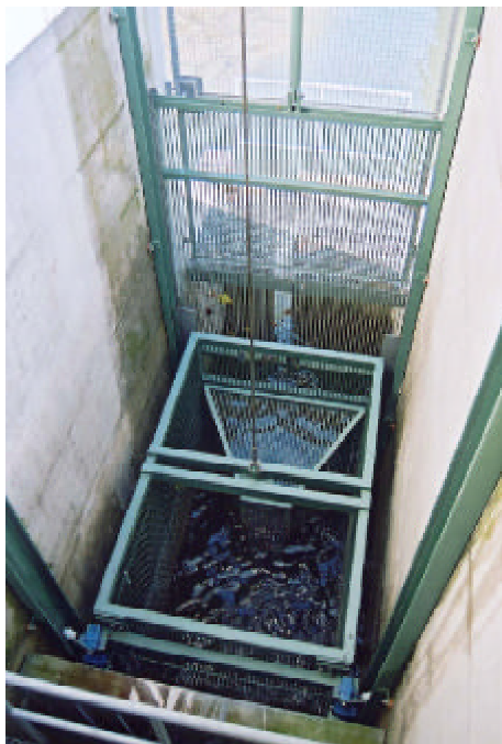
Fangkorb in unterster Position

des Wassers entweder über einen offenen Kanal oder durch ein Rohr ins Oberwasser geführt werden. Im vorliegenden Fall werden die Fische über ein rund 90 m langes Rohr unter Zugabe von Druckwasser ins Oberwasser gespült. Hohe Fließgeschwindigkeiten im Kanal und Turbulenzen im Fassungsbereich verunmöglichen speziell für schlechte Schwimmer die direkte Einleitung in den Oberwasserkanal. Der Hebe- und Absenkvorgang erfolgt automatisch gesteuert in einem festlegbaren zeitlichen Turnus. Dieser richtet sich nach den Wanderaktivitäten der Fische.