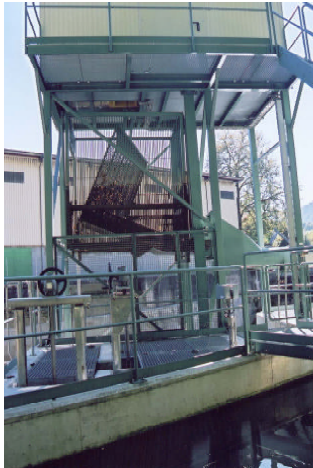
Fangkorb in Entleerposition

Damit während des Transportvorganges nicht Fische in die Fangkammer einschwimmen können, wird der Zugang durch ein Gitter verschlossen. Mit der Abgabe einer Wassermenge von 300 l/s durch die Fischkammer sowie die zusätzliche seitliche Dotierung von nochmals 200 l/s, werden die Fische in Richtung des Einstieges in den Fischlift angelockt und so lange ‚bei der Stange gehalten‘ bis diese den Einstieg passieren können.